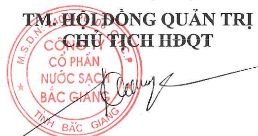
Hướng Xuân Công