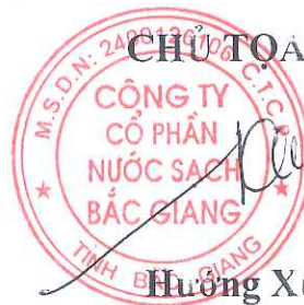
Hương Xuân Công